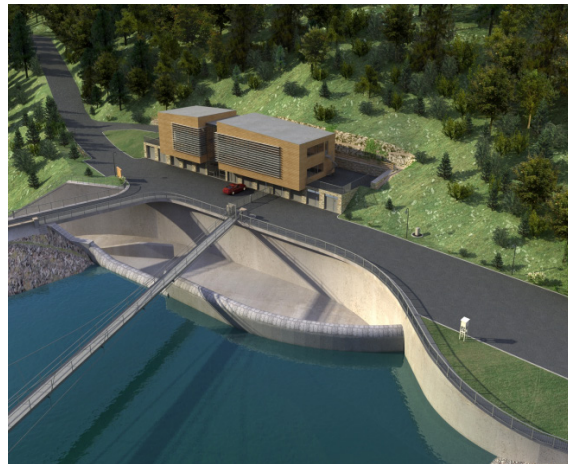
Srovnání dnešní situace v okolí přelivu (vlevo) a stavu po rekonstrukci vodního díla (vizualizace)