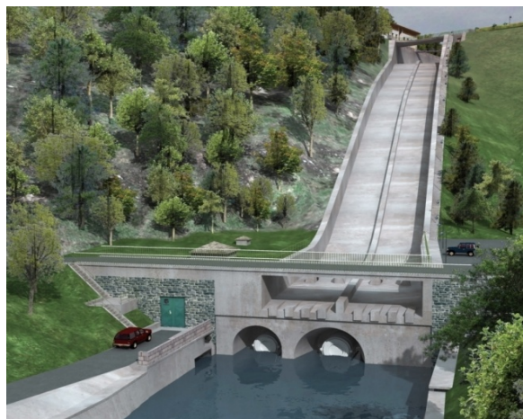
Spodní část skluzu a vývar - srovnání dnešního stavu (vlevo) a stavu po rekonstrukci (vizualizace)